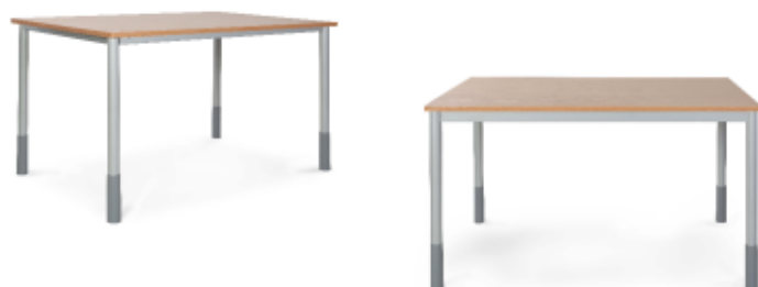
● stół BORYS